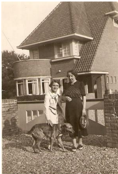
Selly en Clara bij villa Kaja.

Aäron heeft niet lang van zijn mooie villa kunnen genieten. Op 10 april 1937 overleed hij.